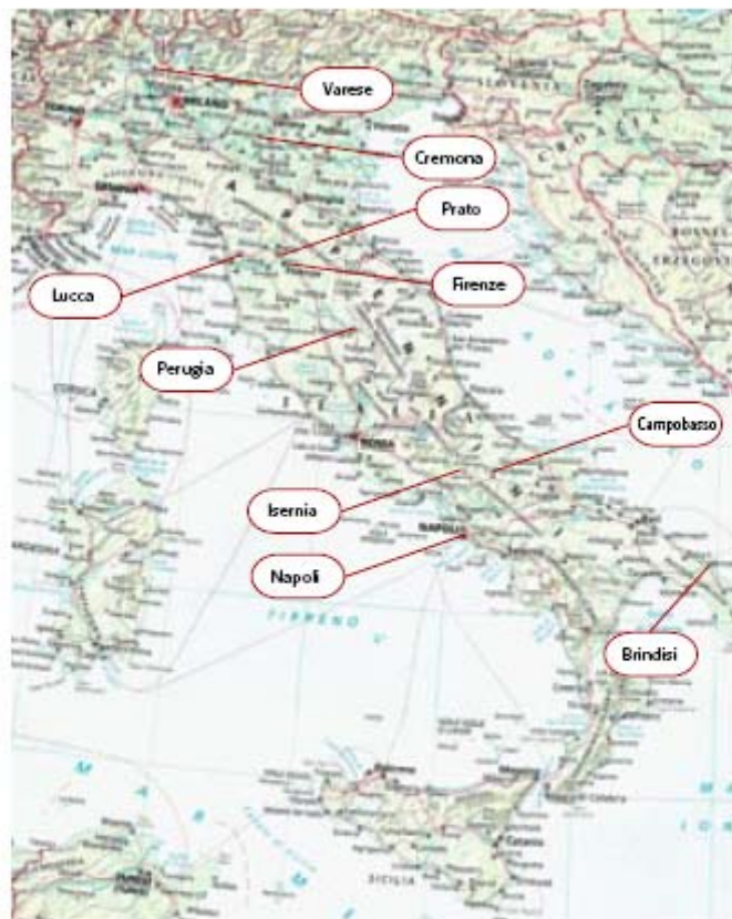
Le Province coinvolte nella sperimentazione del sistema di tracciabilità di Itf.

L'attività di sperimentazione è stata realizzata su circa 50 imprese appartenenti ai settori tessile, abbigliamento, calzature e pelletteria.